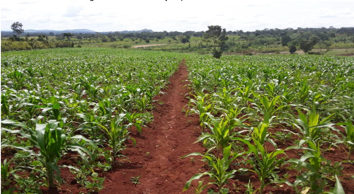
Landbouw(grond) voor zelfredzaamheid van de allerarmsten

Toch mag zelfredzaamheid niet alleen financieel worden gezien. Het opbouwen van zelfvertrouwen en zelfbeeld bij dorpingen, tienermoeders, maar ook bij kinderen in hun eigen kunnen en empowerment door educatie en lifeskills, is een essentieel gedeelte van succes in de toekomst (zoals benoemd door de burgemeester in maart 2023). Het thema “we can do it” loopt als een rode draad door alle programma’s. Daarbij is voorlichting in betere ecologische technieken & milieu en gezondere levensstijl imperatief.