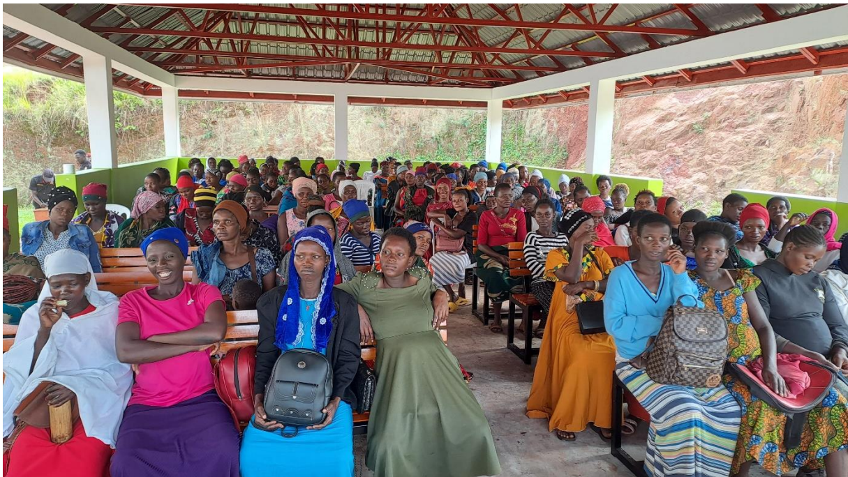
Nieuwe wachtkamer voor prenatale zorg juni 2025

Doelen worden gerealiseerd door definitieve en daadwerkelijke toezeggingen van sponsors en plannen zijn derhalve afhankelijk van de uiteindelijke sponsoring.